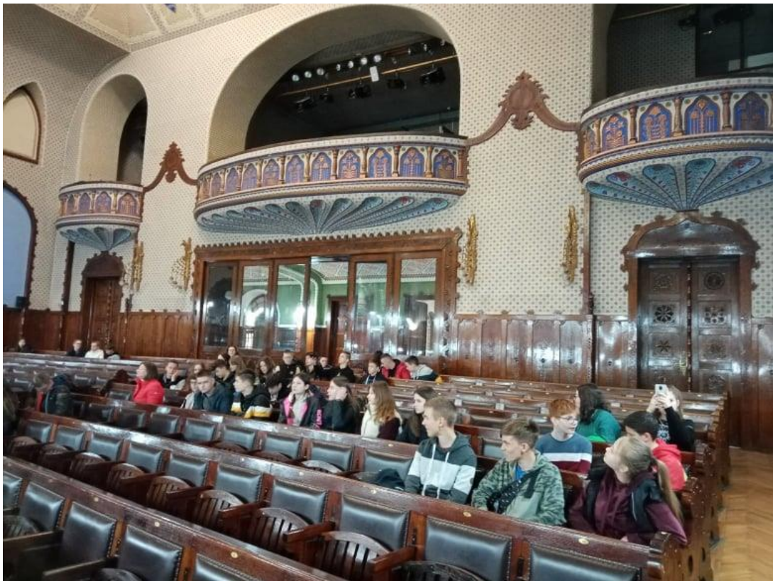
A városháza díszterme