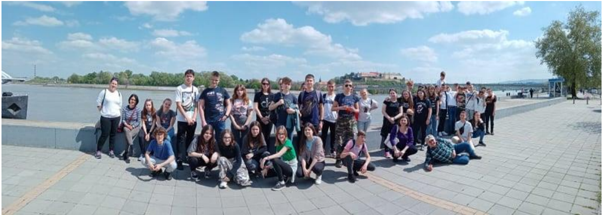
Újvidék, háttérben a péterváradi erőd