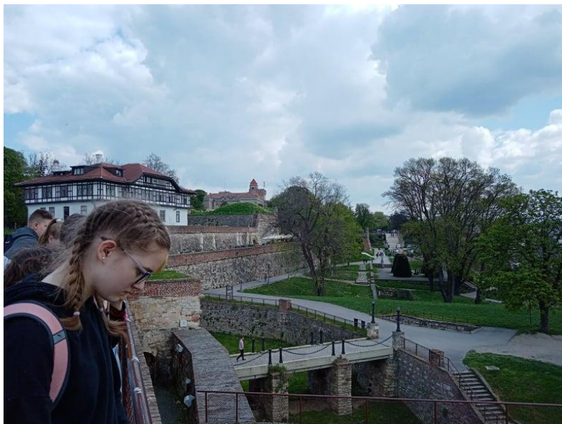
A nándorfehérvári vármúzeum megtekintése