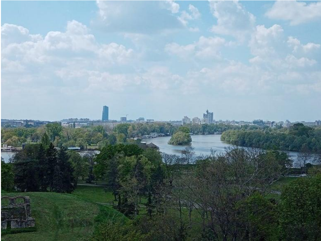
Kilátás Nándorfehérvárból, Duna-Száva összefolyása