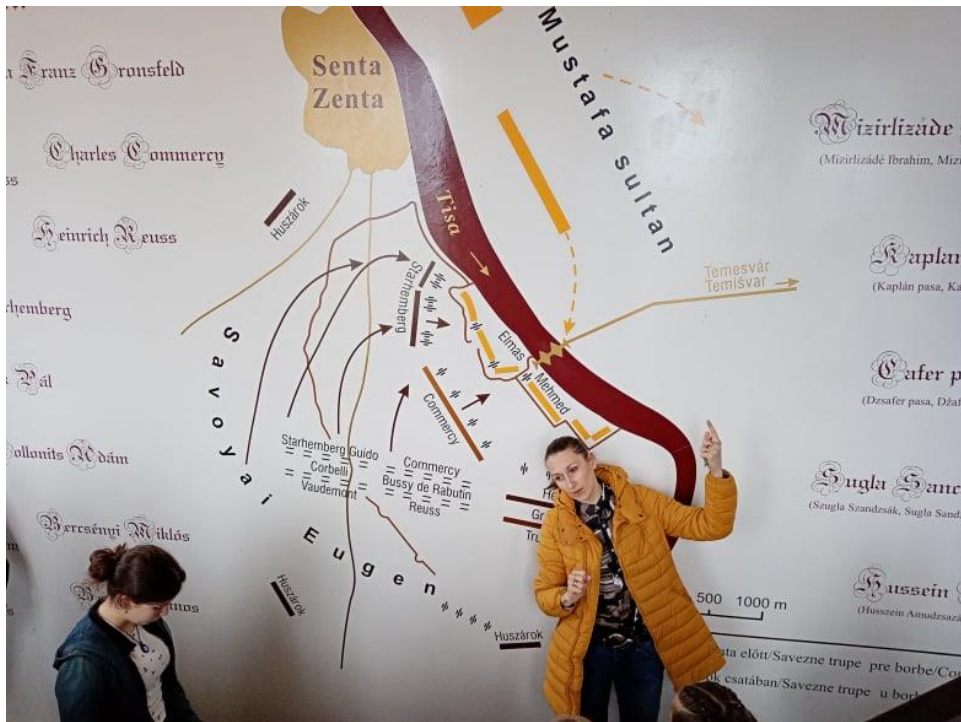
A zentai csata történéseinek elmesélése