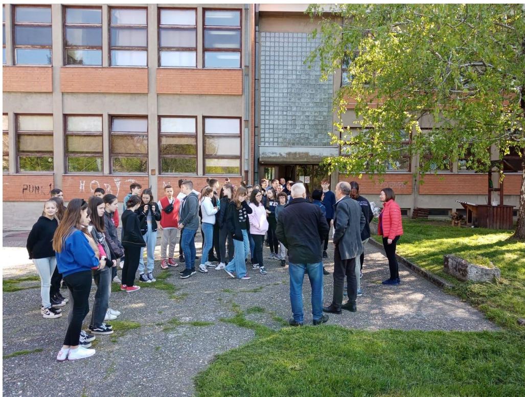
Iskolalátogatás (hátterben az iskolakutyus)