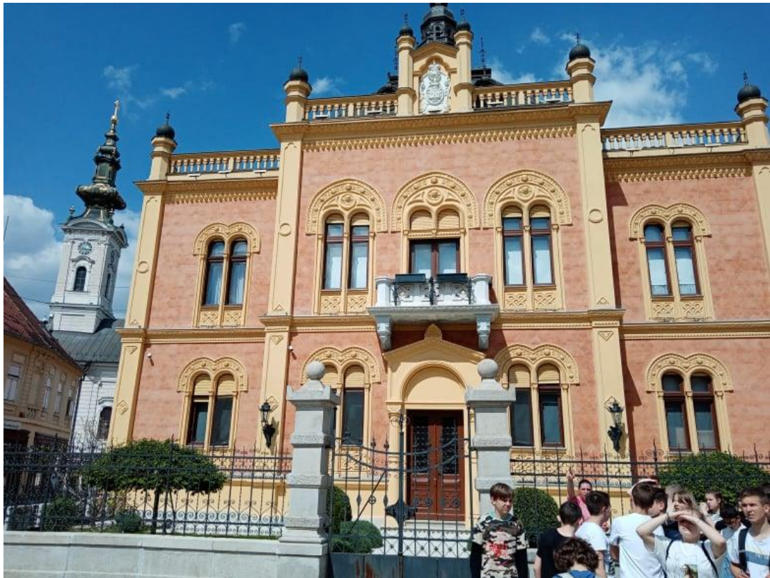
újvidéki Szerb Püspöki Palota