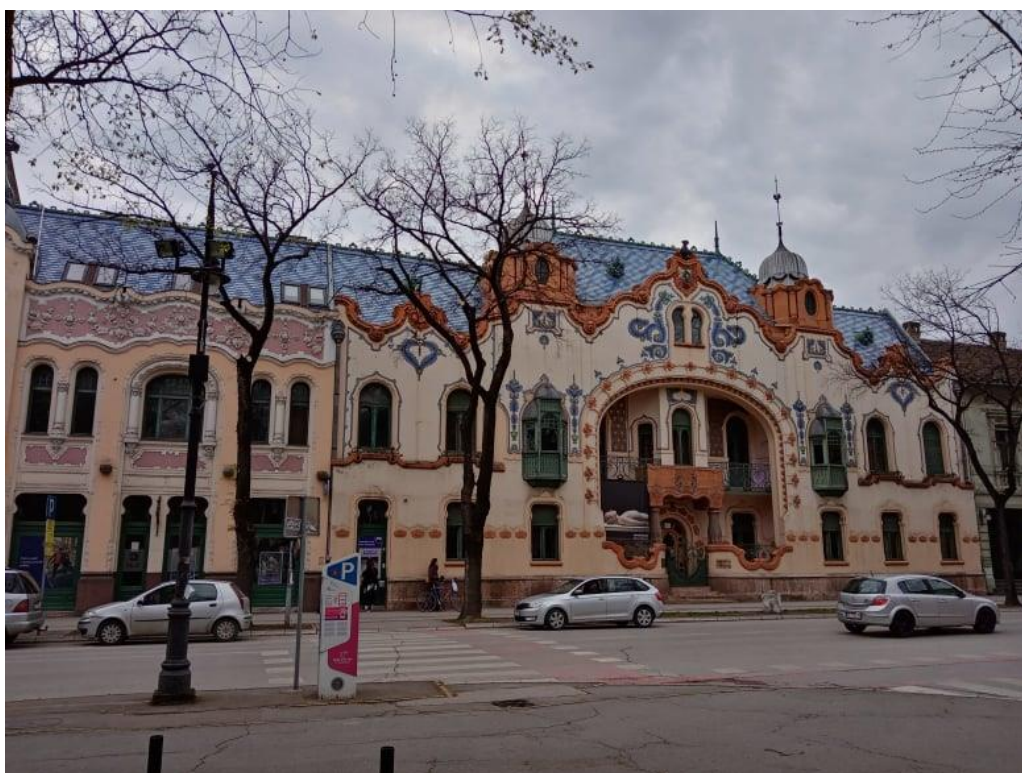
a szabadkai Magyar Konzolátus