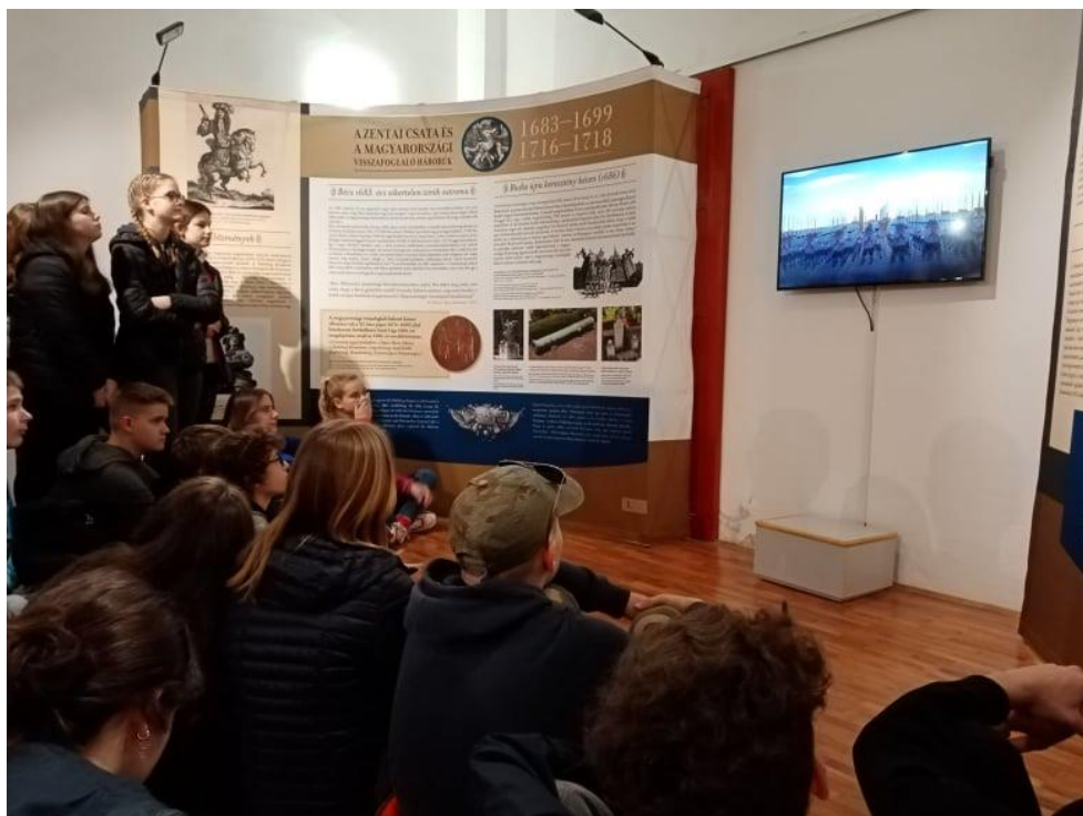
Animációs film a zentai csatáról