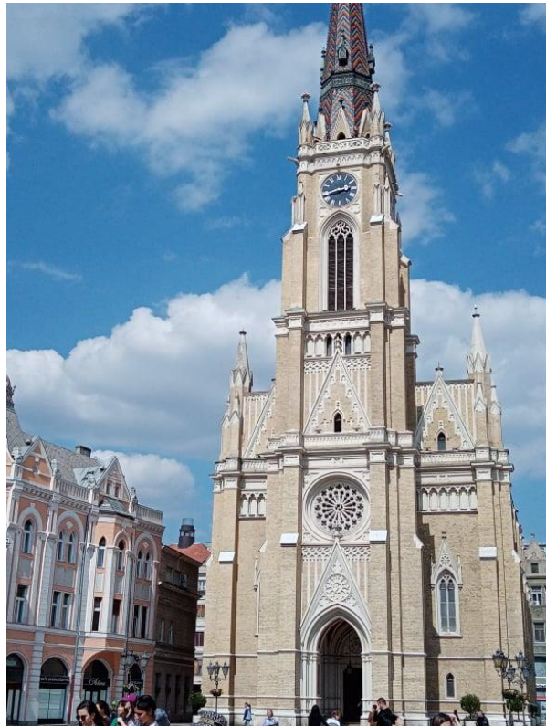
újvidéki Magyar Templom